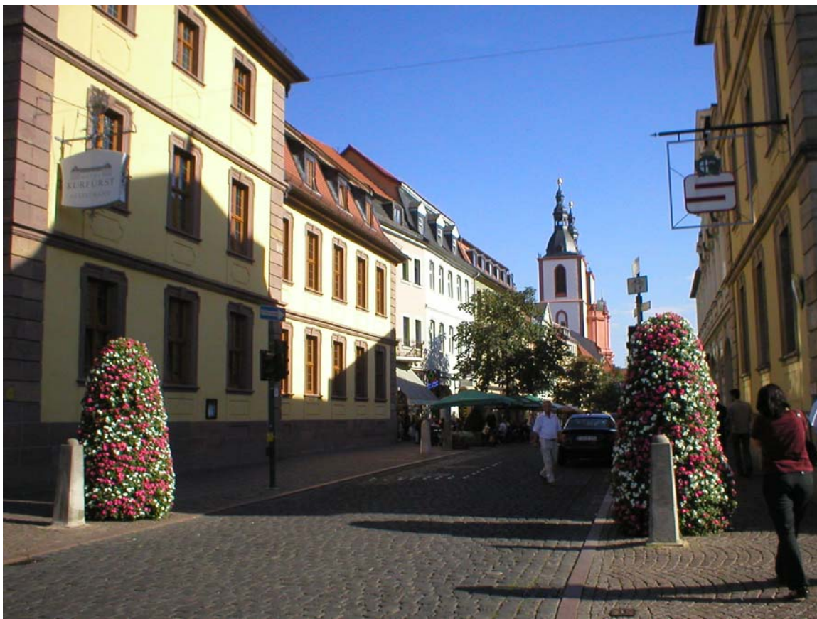
En "typisk" Fulda gata..

Var 28 grader varmt när jag kom hit vid fyra tiden, nu vid tio-tiden är det fortfarande perfekt väder (+24) och uteserveringarna är nästan fullsatta. Fulda är inte stort och jag har nog sett det jag vill se här så imorgon fortsätter jag i riktning mot Kassel.