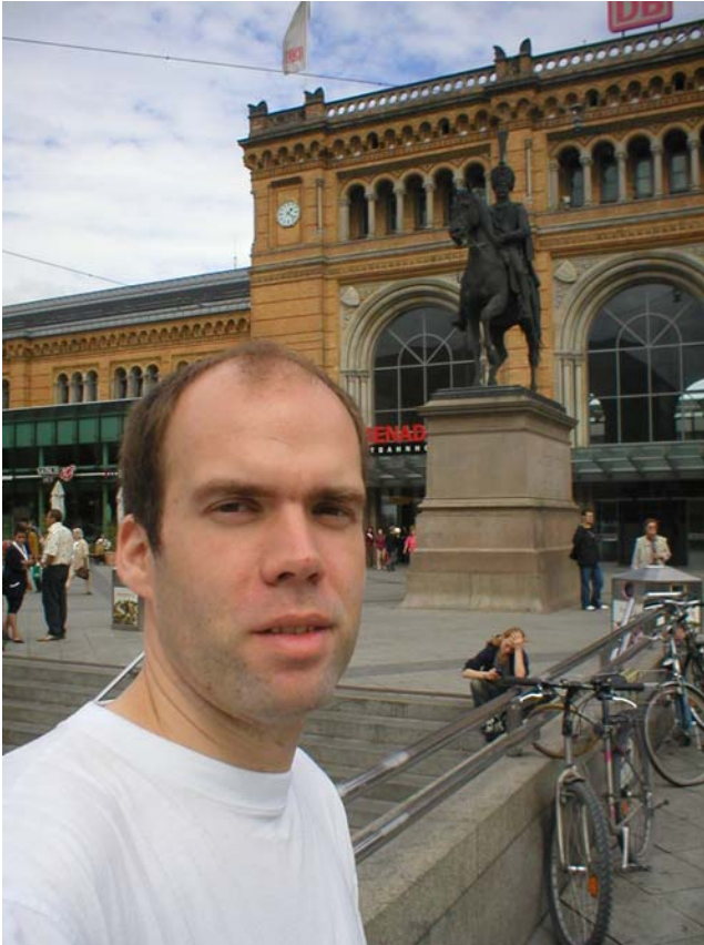
Hannovers järnvägsstation och statyn av den gamle kungen av Hannover.

vad jag tycker om Hannover. Är helt klart den största staden jag varit i hittills om man bortser från Hamburg. Turistinformationen ville ha 6.50€ för att förmedla ett rum så jag beslöt mig för att prova lyckan själv.. man tycker att en stor stad som Hannover borde ha en hel del hotell i olika prisklasser, det finns det säkert också - frågan är ju bara vart??