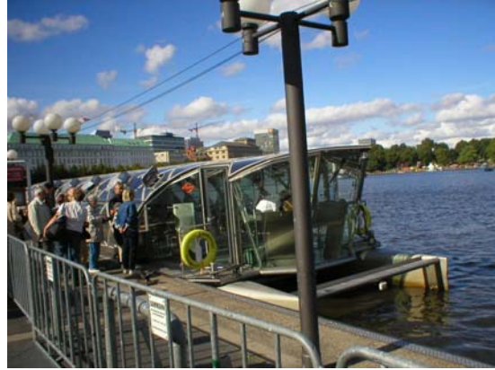
Ombord den soldrivna båten...

Slog mig sedan ned i trappan mellan Jungfernstieg och rådhuset vid kanalen och njöt av en kaffe och butterkuche som jag köpt från en båt på kanalen. Njöt av solen och tittade på alla svanar, duvor och andra fåglar som blev matade vid dom stora skyltarna som förkunnade att "det är coolare att inte mata fåglarna..."