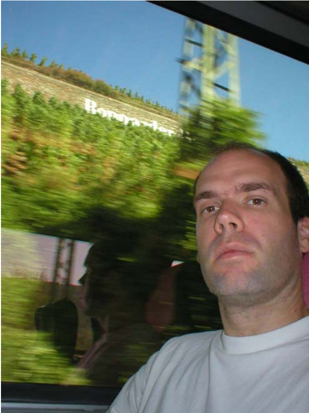
På väg mot Mainz

Efter en utmärkt frukost i Köln steg jag på EuroCity tåg 29 mot Mainz. Klockan 11:38 var jag framme i ett varmt och soligt Mainz. Började vandra lite planlöst för att hitta Turistbyrån, fann till slut en lovande grön skylt där det stod "Türist info" och en gående gubbe brevid. Började följa dom få men naggande goda skyltarna.. efter ca 25 minuters gående i säkert 30-graders värme började jag bli lite less.