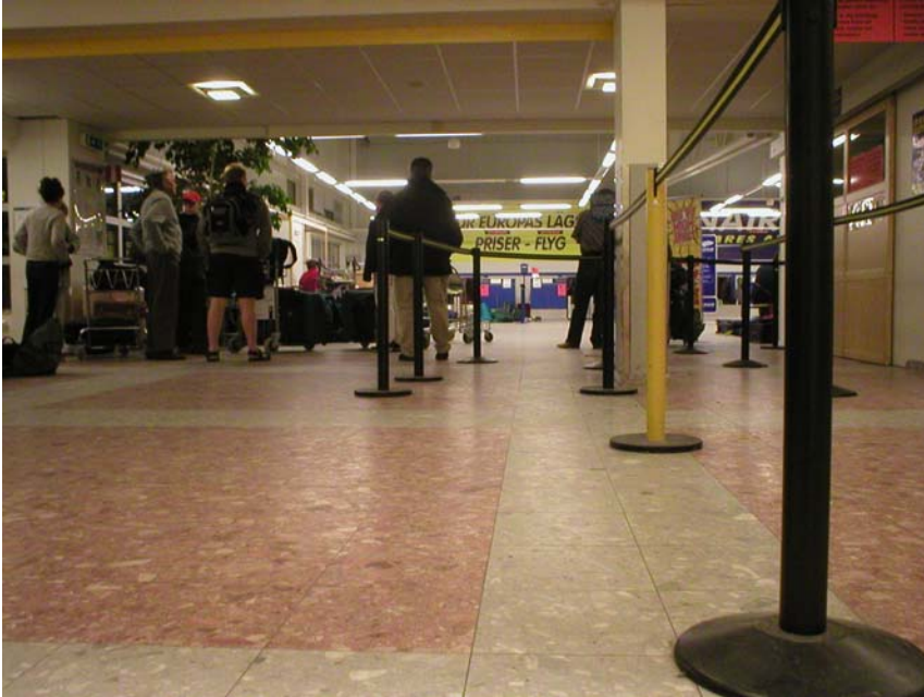
Skavsta flygplats, i väntan på check in

Kom i alla fall iväg i rätt tid och flygningen gick bra ca 55min. Planet var fullsatt, kåkade inget på planet eftersom jag var så himla trött..