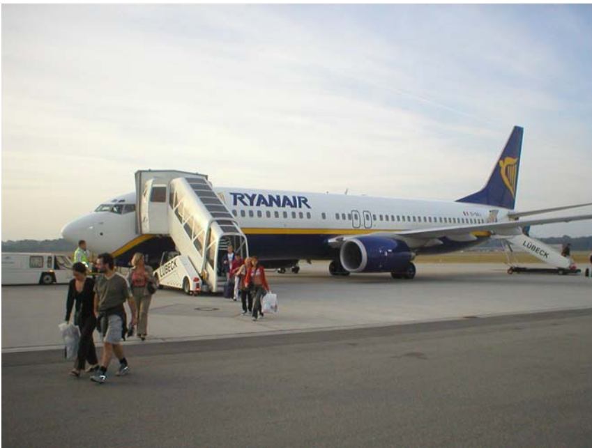
Landat på Lübeck flughafen

Kom i alla fall iväg i rätt tid och flygningen gick bra ca 55min. Planet var fullsatt, kåkade inget på planet eftersom jag var så himla trött..