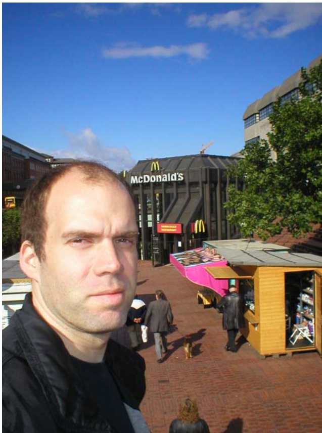
MacDonalds i Altona

Åkte först till Altona där jag käkade frukost på MacD. Gick sedan en tur längs shoppinggatan. Det visade sig att Karstadt hade ett riktigt lågpris varuhus där, vet inte om det höll på att läggas ned det eller om det någon form av outlet med äldre varor eller 2:a handssortering.