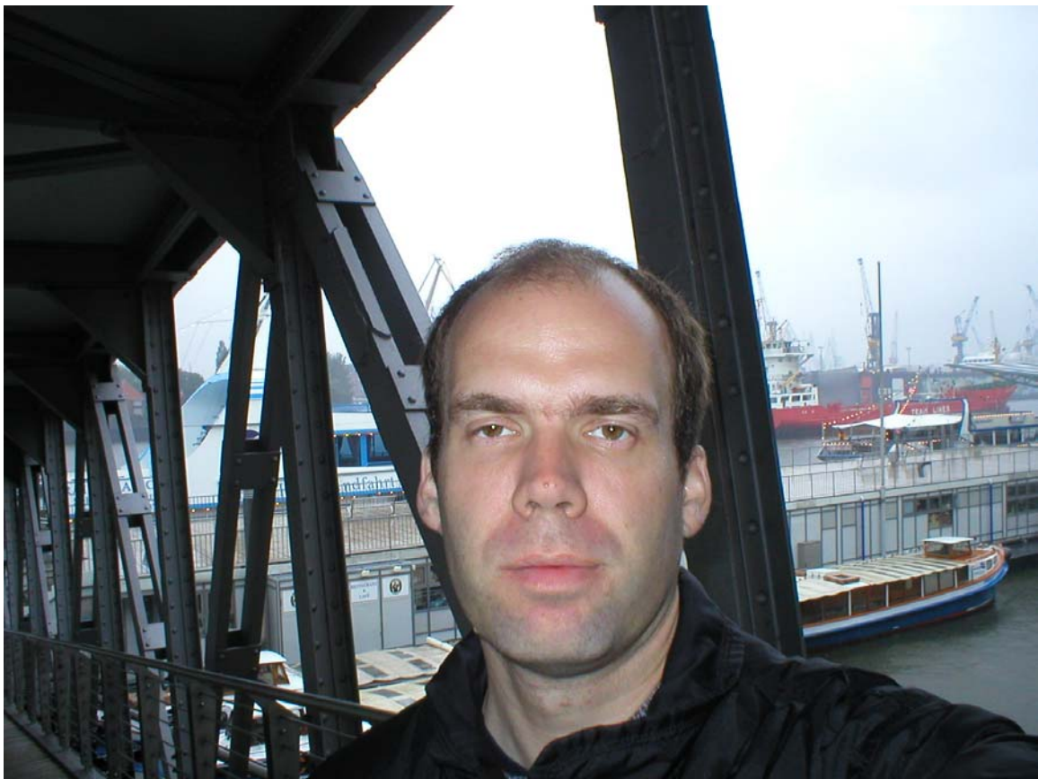
Jag vid Landungsbrücke

Väl framme i Hamburg tog jag S-bahn direkt till Reeperbahn där jag letade upp "Auto hotel am Hafen" och bokade ett enkelrum för två nätter (32€ per natt). Lämpade av min väska och stannade till vid KFC (Kentucky Fried Chicken) och tog en Filét Menü. Åkte sedan en station till Landungsbrücke där jag trotsade regnet och längs hamnen till en butik som säljer diverse saker med anknytning till havet och Hamburg. Var lite sugen på en rätt så ful blå jacka med tyska flaggan på axlarna och HAMBURG tryckt på ryggen. Kollade lite t-shirts också men det blev inga inköp. Var lite kallt och blött så jag drog vidare till Hauptbahnhof igen och kollade in lite butiker och varuhus i city. Åkte upp till översta våningen i "Karstadt Sport" varuhuset och tog en fika med en härlig tårtbit, hade vädret varit fint kunde man ha suttit ute på en fin terrass med utsikt över staden.