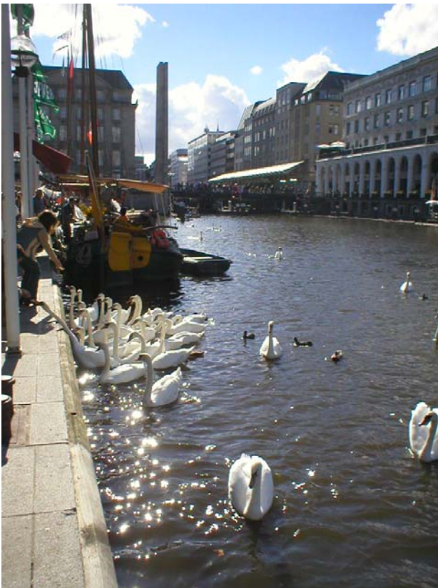
Dom väluppfostrade svanarna..

Verkar dock som om svanarna blivit mer väluppfostrade än vad dom brukar vara, såg inte någon som blev biten alls.. vilket jag sett många gånger vid tidigare besök ;- ) fast dom var kanske så mätta efter allt matande av festivalbesökarna??