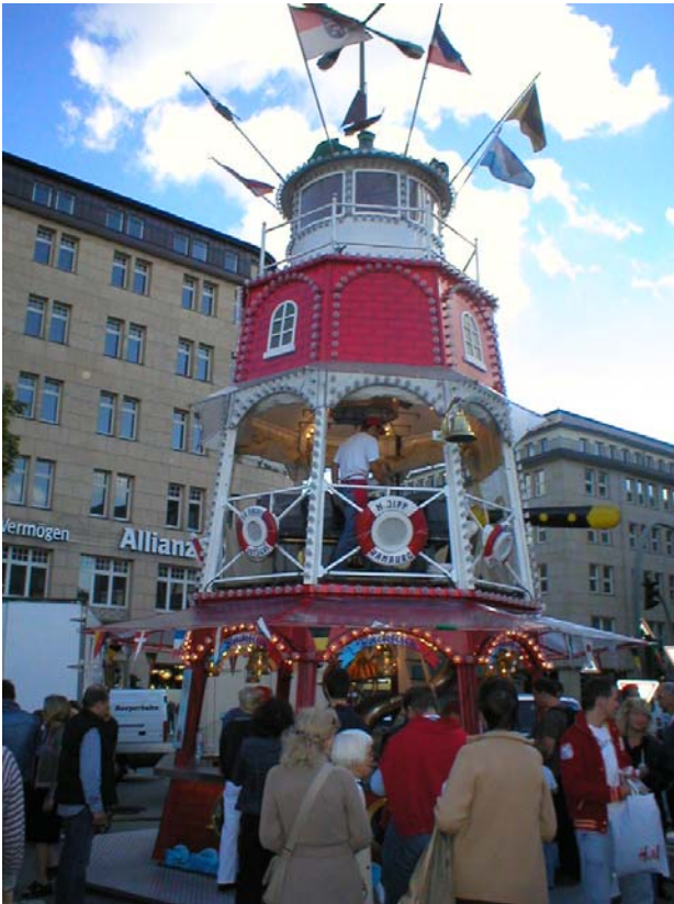
Ett av matstånden på festivalen

Runt hela "Inneralster" så var det olika typer av stånd uppställda med allt från franska crepes, ost, stekt fisk, kött, glass, godis, alla typer av öl, vin och drinkar man kan tänka sig, kläder, mobiltillbehör, vatten spridare i form av en vild galen blomma ;-) och mycket, mycket mer. Fanns dessutom fyra stora scener med live music som tävlade om uppmärksamheten med alla stånd som dom flesta körde sin egen musik på hög volym.