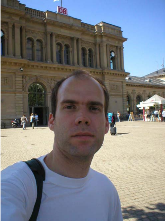
Framför Mainz Hauptbahnhof

Tog en glass, beslöt mig för att åka vidare och gick tillbaka till stationen. På vägen dit köpte jag "Blåbärs-vindruvor" (!), är man inte vaken och helt inkörd på tyska så blir det fel ibland ;-). Trodde jag köpte blåbär, men fick istället 800g små blåbärsstora vindruvor som visserligen var ganska goda men dom var fulla av kärnor och efter en klase så var det mer än nog..