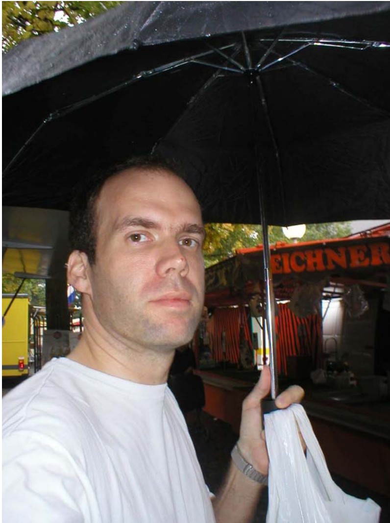
Under ett paraply på Münsters marknad där jag köpte goda blåbär.

Just nu är jag i staden Münster, har tyvärr regnat en hel del men nu skiner solen och det är väldig varmt och skönt trots att klockan närmar sig halv åtta.