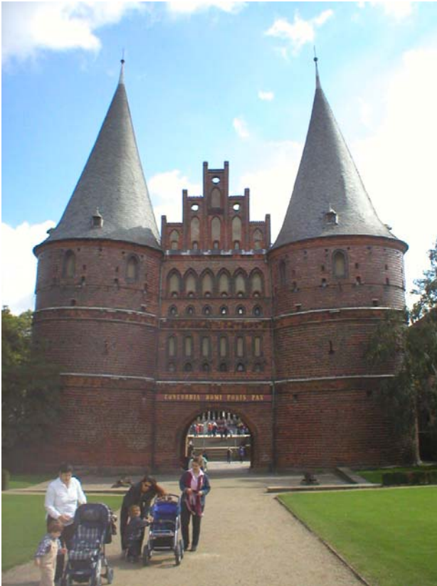
Lübecks mest kända stadsport

Kom fram till Lübeck vid 12-tiden och gick direkt till turistinfon där dom hjälpte mig att hitta en rum för 41€ (med wc och dusch) precis innanför vallgraven. Nu är inte Lübeck den roligaste staden att vara i en söndagseftermiddag med halvtaskigt väder och en del skurar.. gick runt ett tag och konstaterade att i stort sett alla butiker var stängda och att många gator var rätt så ödsliga.