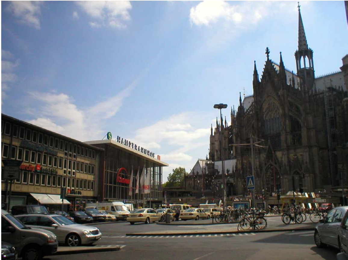
Järnvägsstationen till vänster och Kölns dom till höger

Resten av dagen gick jag mest runt och glassade i solen. Ett par kvarter är helt för fotgängare vilket ju är trevligt..