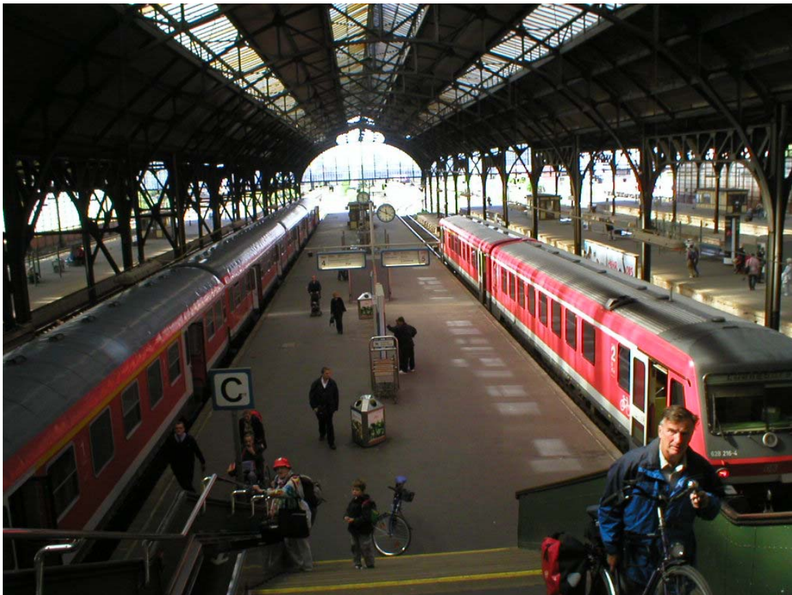
Sista stationen för den gången..

Tog sedan 22:02 tåget till Lübeck och var framme strax innan elva snåret. Gick istort sett raka vägen till hotellet och somnade.