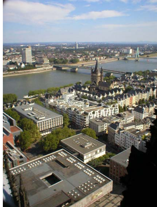
Vyer från Domens sydtorn

Imorgon åker jag vidare mot Mainz (troligen) efter ytterligare en härlig frukost på mitt trevliga hotell :-)