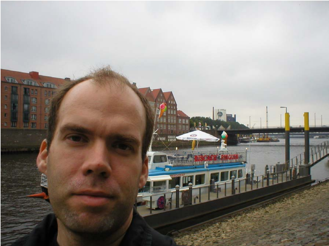
På väg mot Beck's bryggerier som syns långt bort på andra stranden..

Var förbi turistbyrån och kollade in vad staden hade att erbjuda. Det visade sig att Beck & Co's bryggeri låg i närheten och att dom hade visningar av fabriken med tillhörande provsmakning på slutet. Visserligen stod det att man borde förhandsboka men jag travade dit på vinst och förlust. Det visade sig att turen redan börjat när jag väl kom fram men det gick bra att haka på ändå, och som sagt provsmakningen var ju sist på programmet. Kostade 3€ och det enda jag missade var en allmän presentation av företaget vilket ju inte gjorde så mycket.. Visningen var väl ok, litet museum och filmvisning. Sedan var det dags för provsmakningen, började med blindtest av två sorter. Hade förstås ingen aning om vad som var vilket, har nog aldrig druckit Becks tidigare, fast det var ingen i gruppen som klarade båda sorterna. Satt tillsammans med ett trevligt par från Australien och en "galen" skåning som var på väg hem efter att ha cycklat till Köln..Fick aldrig någon förklaring om varför han varit där men han skulle tydligen inte cykla så mycket mer när han väl kommit hem.. ;-)