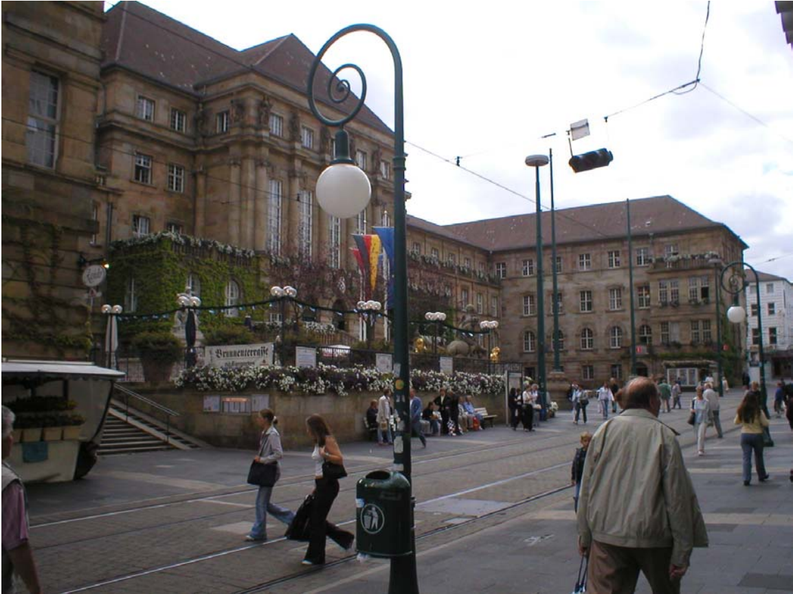
Rådhuset i Kassel

Kassel är ganska mkt större än Fulda fast inte alls lika vacker. I alla fall inte dom centrala delarna. Det finns en väldigt, väldigt lång kombinerad gång-, shopping- och spårvagnsgata där dom flesta butiker verkar ligga samt på angränsade tvärgator. Verkade som om prisnivån var lite lägre än dom andra städerna jag varit på (bortsett från hotellen..) Fanns också en hel del riktiga lågprisbutiker ganska centralt.