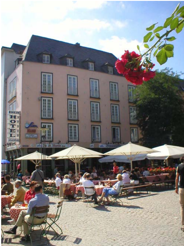
Mitt trevliga (och billiga) hotel i Köln

Är nu inne på min andra dag här i Köln. Minnesgoda läsare kanske kommer ihåg att jag i förra dagboksinslägget skrev att jag antagligen skulle ta en liten längre tågrespa eftersom det var söndag, det blev alltså inte riktigt så ;-). Igår var nästan alla butiker stängda här, fast Köln verkar vara en ganska stor turiststad så det fanns en hel del att titta på ändå. Hittade ett bra hotell till rimligt pris 50€ för två nätter med frukost och dusch och TV på rummet.