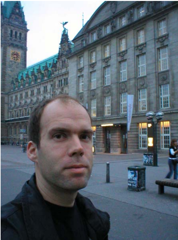
Framför Hamburgs rådhus